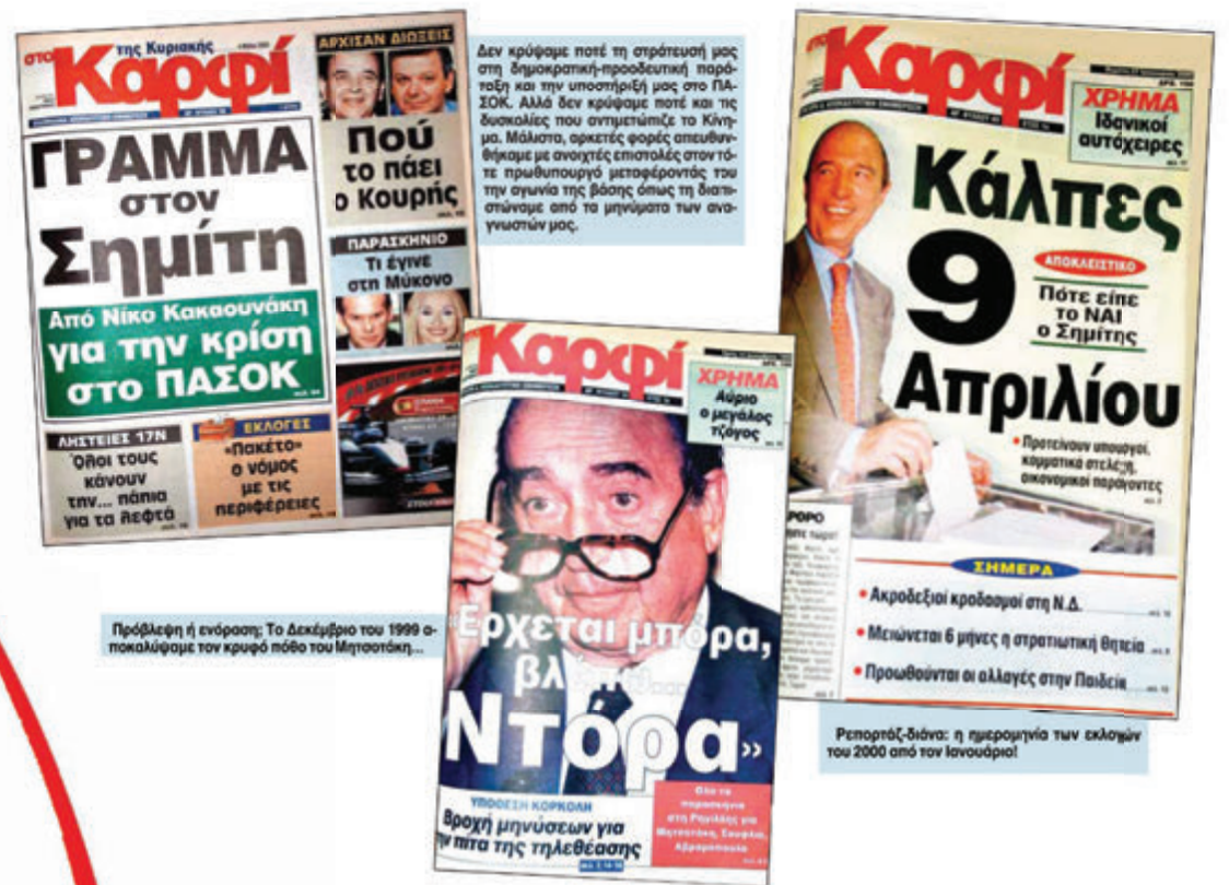
Πρόβλεψη ή ενόραση; Το Δεκέμβριο του 1999 αποκαλύψαμε τον κρυφό πόδο του Μητσοτάκη...

...Θυμάμαι πολλές φορές στο δεύτερο όροφο στο γραφείο του στη Μεσογείων, που ξενυχτούσαμε μέχρι να καταλήξουμε στο θέμα που θα βάζαμε πρωτοσέλιδο. Και, πράγματι, δημοσιογράφοι και αναγνώστες είχαν να πουν για τα πρωτοσέλιδα του «Καρφιού», που στην πλειοψηφία τους αναδείκνυαν το σκληρό και αληθινό πρόσωπο της Δεξιάς, στην οποία πάντα ήμασταν απέναντι. Όλοι εμείς συνεχίζουμε να υπερασπιζόμαστε τη μεγάλη προοδευτική παράταξη της Κεντροαριστεράς, ασκώντας κριτική για τα όποια λάθη γίνονται εις βάρος του συνόλου της κοινωνίας και αναδεικνύοντας με τον πιο γλαφυρό τρόπο τις ανάγκες και τα προβλήματα που αντιμετωπίζουν καθημερινά οι πολίτες. Μπορεί να μην είμαστε η πρώτη σε κυκλοφορία εφημερίδα, αλλά είμαστε μια καθαρή και δυνατή φωνή. Και αφού είστε μαζί μας, εσείς οι ίδιοι είστε το «Καρφί».