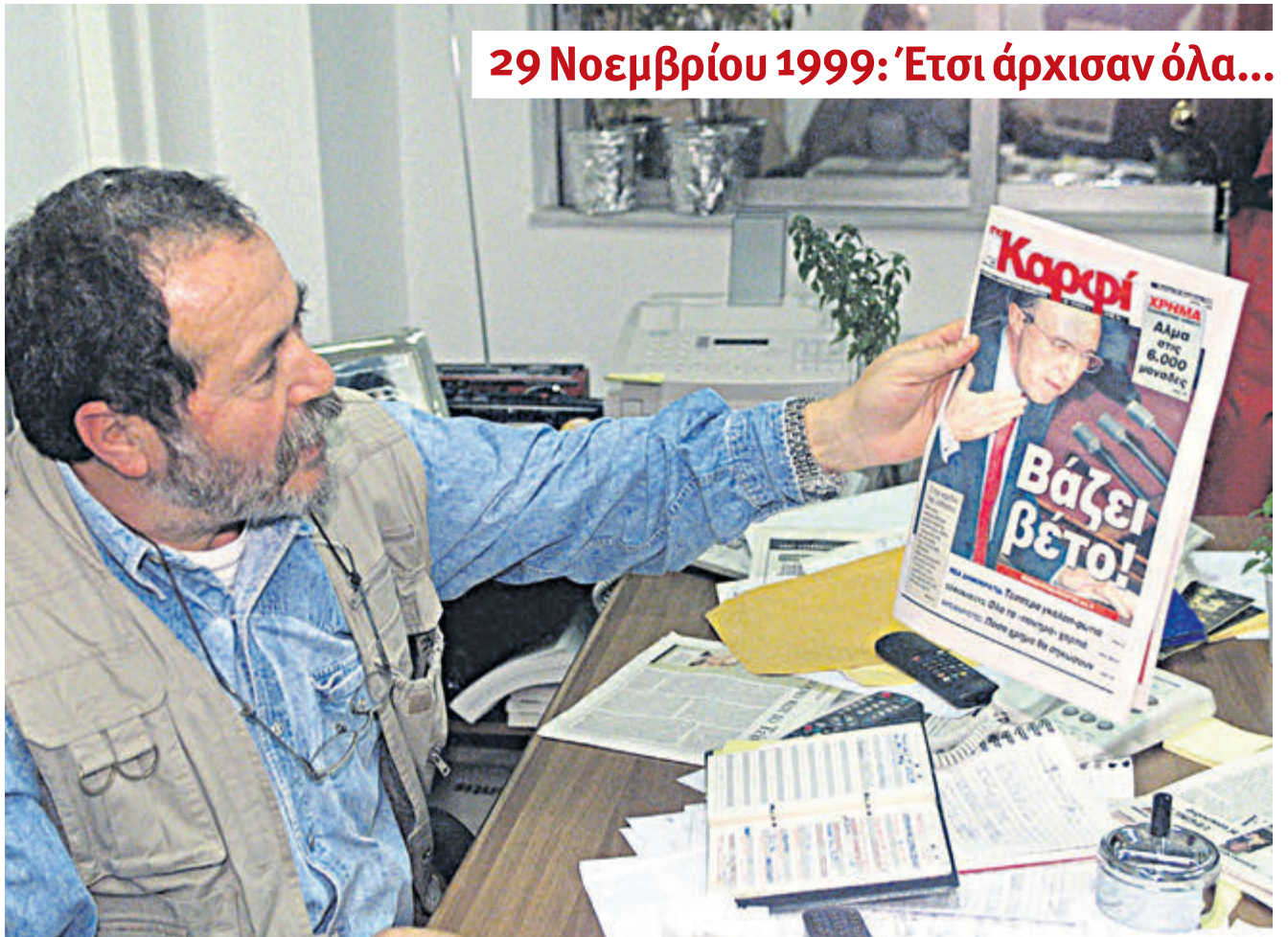
29 Νοεμβρίου 1999: Έτσι άρχισαν όλα...

Έπειτα από 25 ολόκληρα χρόνια, οι δυσκολίες είναι μεγάλες και με την πάροδο του χρόνου γίνονται μεγαλύτερες. Θα χρειαστούν εντονότερες προσπάθειες εκ μέρους μας και ενεργότερη στήριξη από εσάς για να περάσουμε τον κάβο. Την τύχη μιας εφημερίδας τη «γράφουν» οι αναγνώστες της.